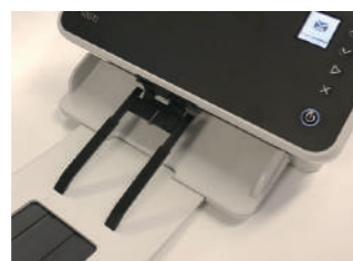
スタッキングディフレッカー

アクティブフィードテクノロジー、コントロール排紙機能、スタッキングディフレッカーおよびティルトスタンドの採用で従来機を凌ぐ紙送りの安定性を実現。安定した紙送りにより、OCR対象書類のイメージは正確性が増し、サイズの異なるレシートもばらつきなくまとめてスキャンできます。