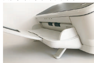
ティルトスタンド