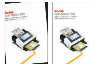
▲一般的なスキャニング: 傾いたままスキャンされてしまう ▲パーフェクトページによるスキャン: 自動でイメージの傾きや余計なバックグラウンドの除去を実行